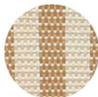
RAYE IVOIRE | MIEL