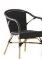
FAUTEUIL MADELEINE 9187LBL

L60 P62 H80 HA45 HAC68 23.7" 24.5" 31.5" 17.8" 26.8"