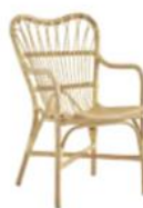
FAUTEUIL MARGRET | 1003U L56 P64 H90 HA45 HAC65 22.1" 25.2" 35.5" 17.8" 25.6" ▲ □