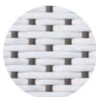
BLANC | POINTS CAPPUCCINO