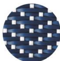
BLEU NAVY | POINTS BLANC