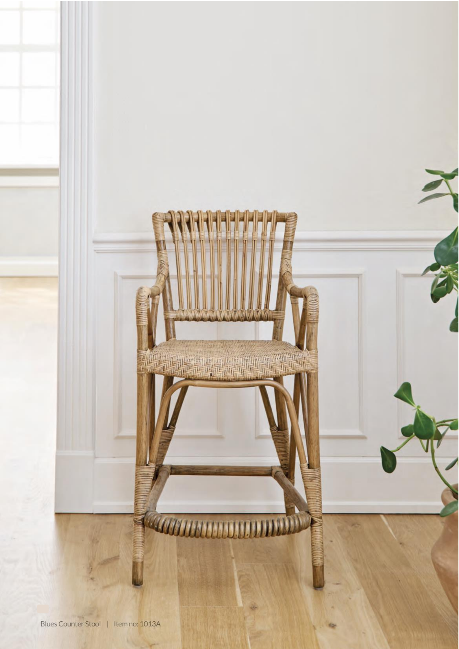
Blues Counter Stool | Item no: 1013A