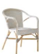
FAUTEUIL MADELEINE 9187CPWH

L60 P62 H80 HA45 HAC68 23.7" 24.5" 31.5" 17.8" 26.8"