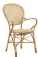
FAUTEUIL ROSINI | 1007U L56 P58 H93 HA45 HAC65 22.1" 22.9" 36.7" 17.8" 25.6" ▲ □