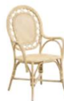
FAUTEUIL ROMANTICA | 1015U L57 P61 H100 HA45 HAC65 22.5" 24.1" 39.4" 17.8" 25.6" □