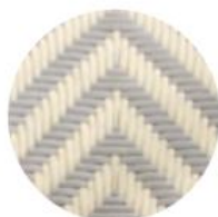
CHEVRON IVOIRE | GRIS