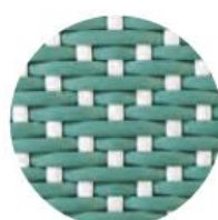
VERT SALVIE | POINTS BLANC