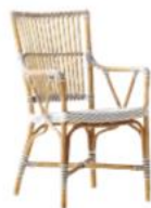
FAUTEUIL MONIQUE 9186CPWH

L54 P62 H93 HA46 HAC65 21.3" 24.5" 36.7" 18.2" 25.6"