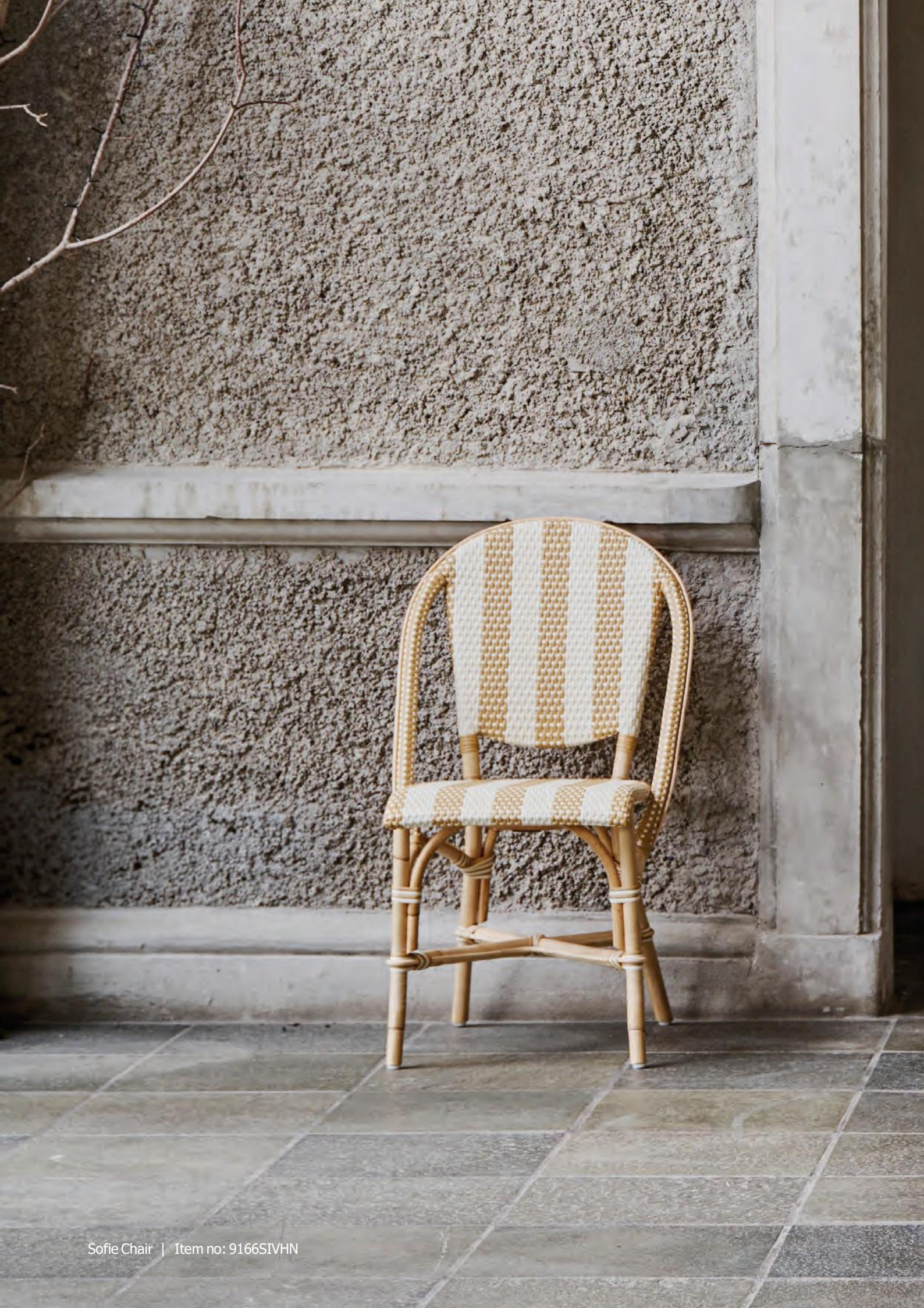
Sofie Chair | Item no: 9166SIVHN