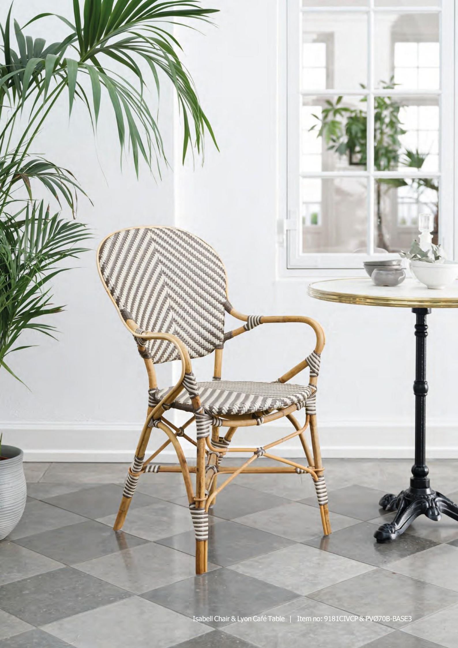
Isabell Chair & Lyon Café Table | Item no: 9181CIVCP & PV070B-BASE3