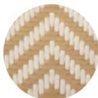
CHEVRON IVOIRE | MIEL