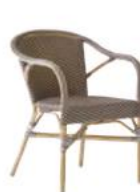
FAUTEUIL MADELEINE 9187WHCP

L60 P62 H80 HA45 HAC68 23.7" 24.5" 31.5" 17.8" 26.8"