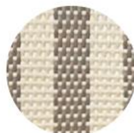
RAYE IVOIRE | CAPPUCCINO