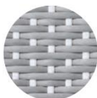
GRIS | POINTS BLANC