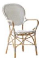
FAUTEUIL ISABELLE 9181CPWH

L54 P57 H92 HA45 HAC64 21.3" 22.5" 36.3" 17.8" 25.2"