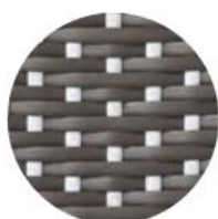
CAPPUCCINO | POINTS BLANC