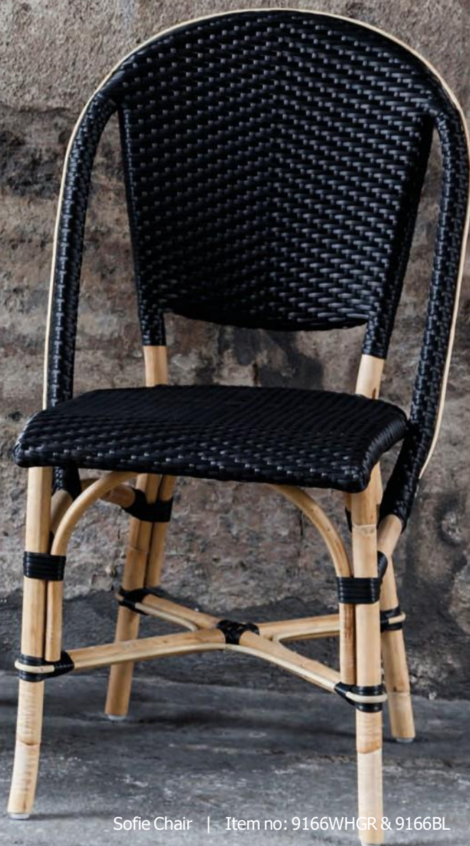
Sofie Chair | Item no: 9166WHGR & 9166BL