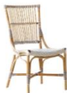
CHAISE MONIQUE 9185CPWH

L54 P62 H93 HA46 21.3" 24.5" 36.7" 18.2"