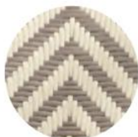
CHEVRON IVOIRE | CAPPUCCINO