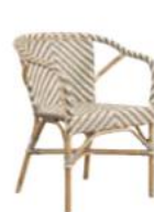
FAUTEUIL MADELEINE 9187CIVCP

L60 P62 H80 HA45 HAC68 23.7" 24.5" 31.5" 17.8" 26.8"