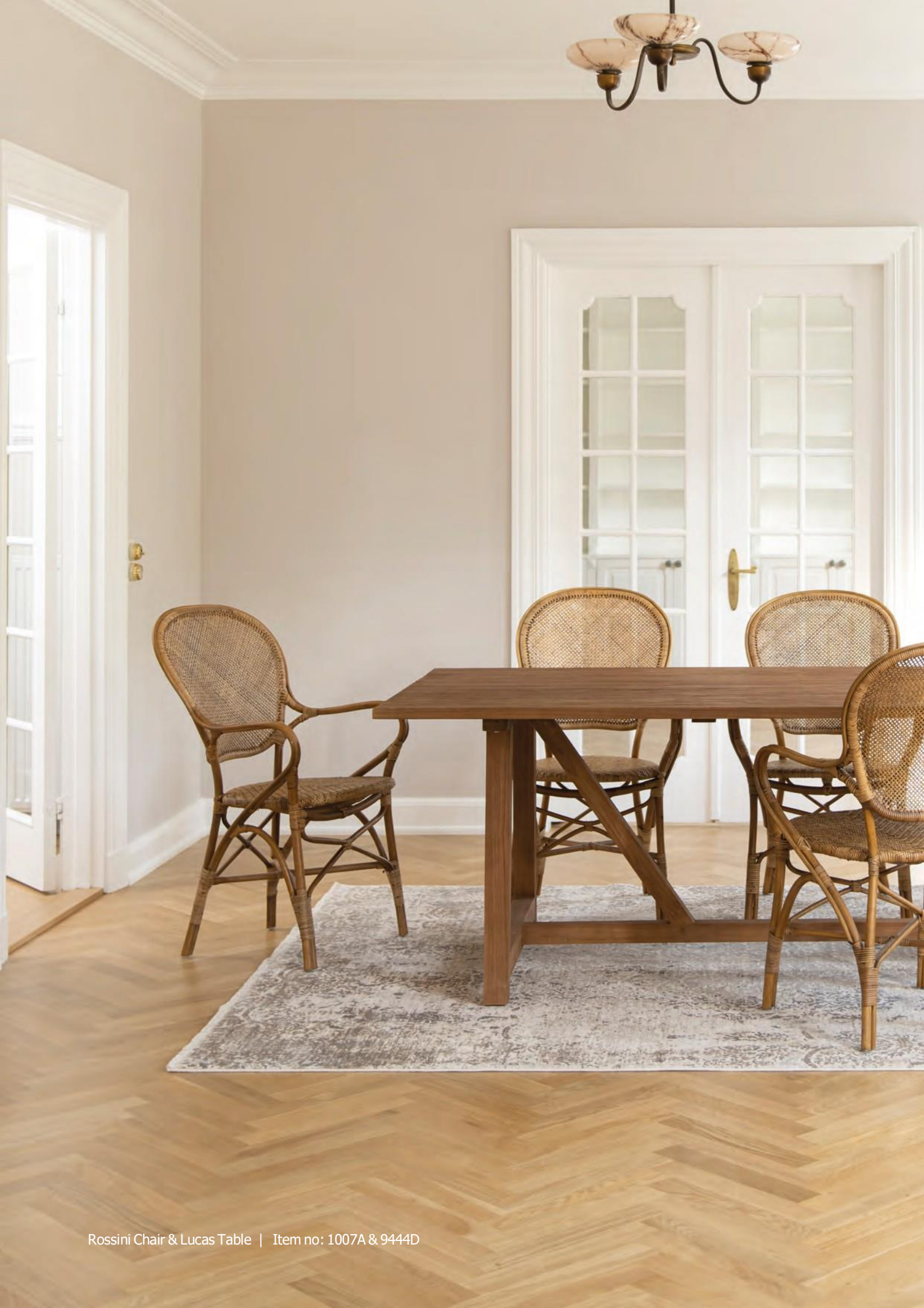
Rossini Chair & Lucas Table | Item no: 1007A & 9444D